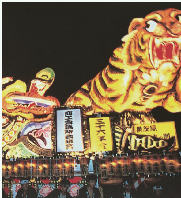
あおもり まつり 青森ねぶた祭 青森灯笼节