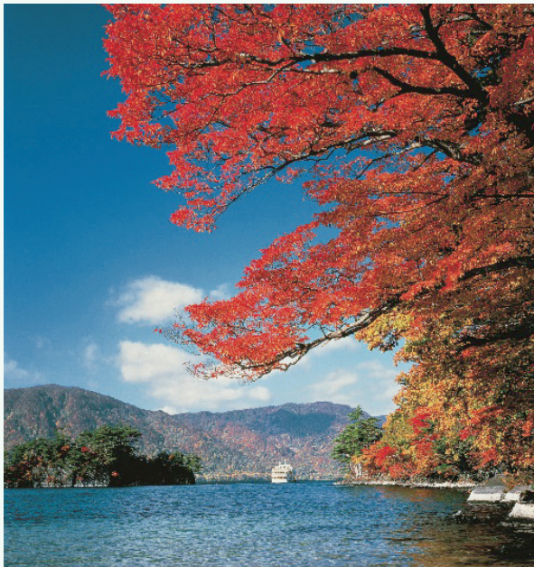
とわだこ 十和田湖 十和田湖

此外，奥入瀬溪流从十和田湖流出，约14公里。繁茂的树木和十多处瀑布，与溪流千变万化的涓涓流水和各色奇石、奇景形成了美丽的溪流景观。一年四季都可以欣赏到自然美景。