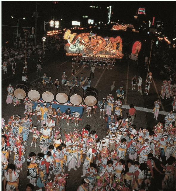
はねと 跳人 跳人