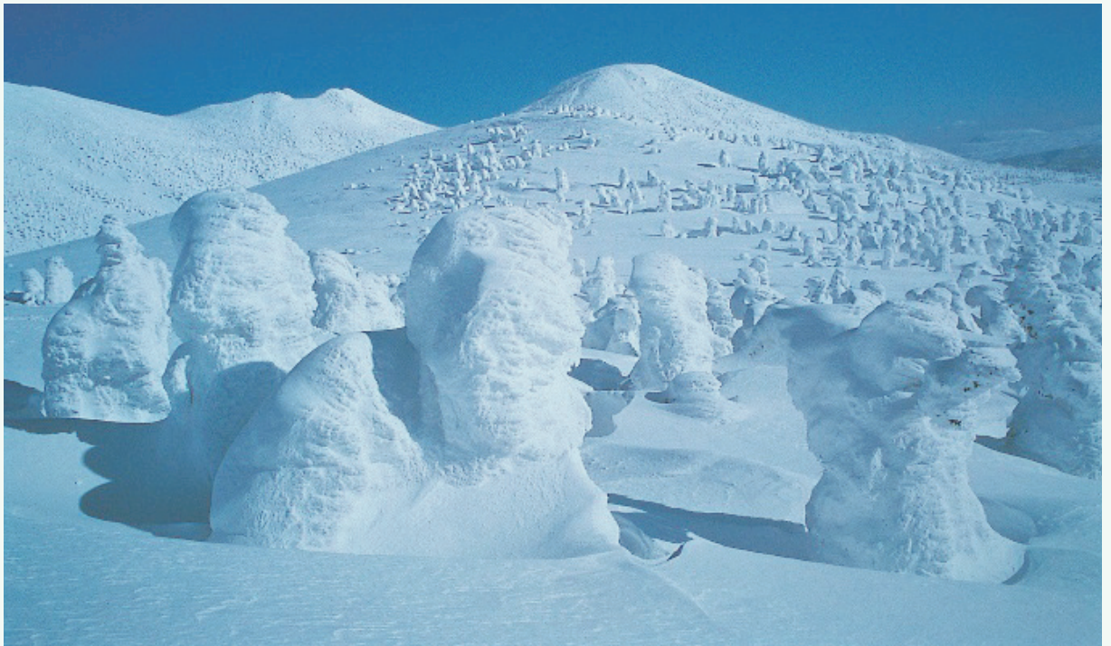
はっこう ださん じゅひやう 八甲田山・樹氷

在凛冽的风雪中傲然挺拔的八甲田树木宛若冰雪巨 人一般动人心魄，变身为美丽的雾凇。