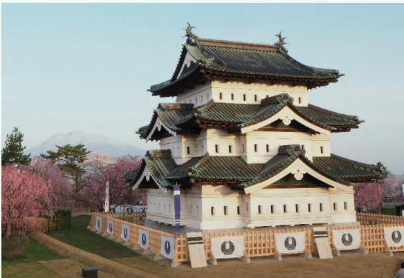
ひろさきじょう 弘前城 弘前城