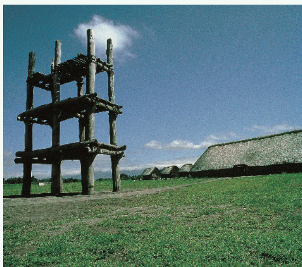
さんないまるやまいせき 三内丸山遺跡 三内丸山遗址

雄伟的自然风光，再加上拥有绳文时代的古迹“三 内丸山遗址”、作为日本第一的赏樱胜地而被人们熟知 的“弘前城”、以日本第一夏季庆典活动而闻名的“青 森灯笼节”等文化资源，多样的文化和壮丽的自然风光 引人入胜。