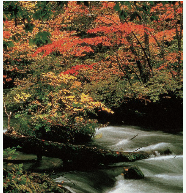
おいらせけいりゅう 奥入瀬溪流 奥入瀬溪流