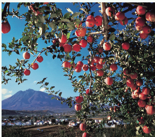
いわきさん 岩木山 岩木山

ゆうだい しぜん くわ じょうもんじだい しせき さんない 雄大な自然に加えて、縄文時代の史跡である「三内 丸山遺跡」や日本一の桜の名所として知られる「弘前 城」、日本一の夏祭りとして有名な「青森ねぶた祭」 など文化資源にも恵まれており、多様な文化と雄大な 自然が訪れる人々を魅了します。